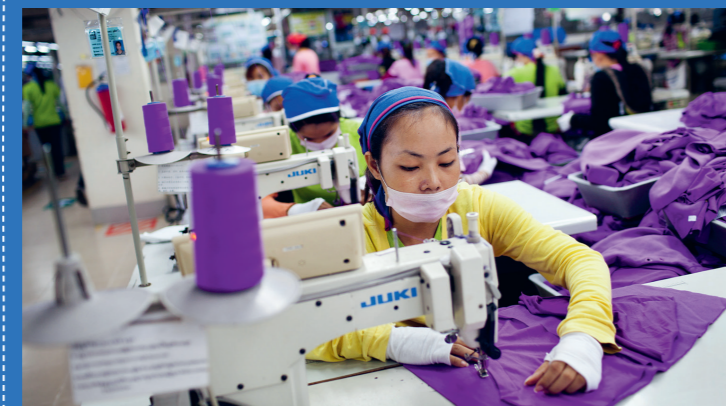
Adidas-Zulieferer in Kambodscha.

Unsere Sportmarken, egal wie teuer, sind nicht fairer als andere Modemarken. Auch sie wollen immer mehr Gewinn erzielen, je höher desto besser. Und immer schneller wachsen ihre Etats für Marketing und Vertrieb. Fairness zählt in der Produktion wenig! Überall dort, wo Sportartikel produziert werden, kommt es jeden Tag zu Arbeits- und Menschenrechtsverletzungen. Die meisten Sportartikel werden in Asien produziert, aber Puma und Adidas lassen zum Beispiel auch in Mittelamerika für sich nähen. Sportmarken machen jährlich Millionen-gewinne, während die vorwiegend weiblichen Näher*innen unter den schwierigen Bedingungen und dem enormen Arbeitsdruck in der Fabrik leiden. Gewerkschaftliche Organisation wird im Keim erstickt. Die Arbeiter*innen schufteten oft in erzwungenen Überstunden 7 Tage die Woche und können von ihrem Hungerlohn kaum leben.