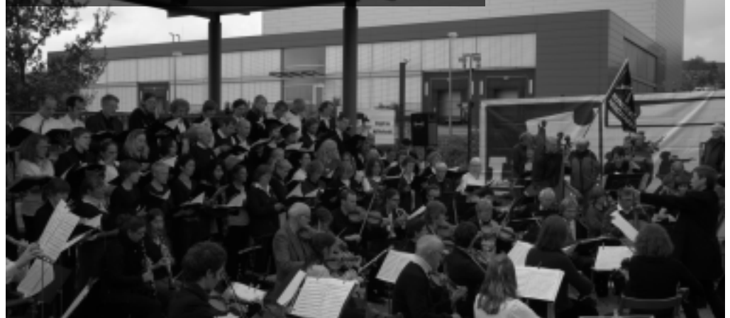
Konzert-Blockade der Waffenfabrik von Heckler & Koch, 2012

Auch in diesem Jahr finden wir uns fünf Tage vor der Konzertaktion vor Ort ein. Wir bereiten uns gemeinsam und intensiv auf unsere Konzert-Aktionen vor und handeln auch gemeinsam. Entscheidungen treffen wir basisdemokratisch, Bedürfnisse und Bedenken aller sollen berücksichtigt werden. Es bleibt stets in der Verantwortung der Teilnehmenden, wie weitgehend sie sich einbringen. Betroffene möglicher rechtlicher Konsequenzen unterstützen wir solidarisch.