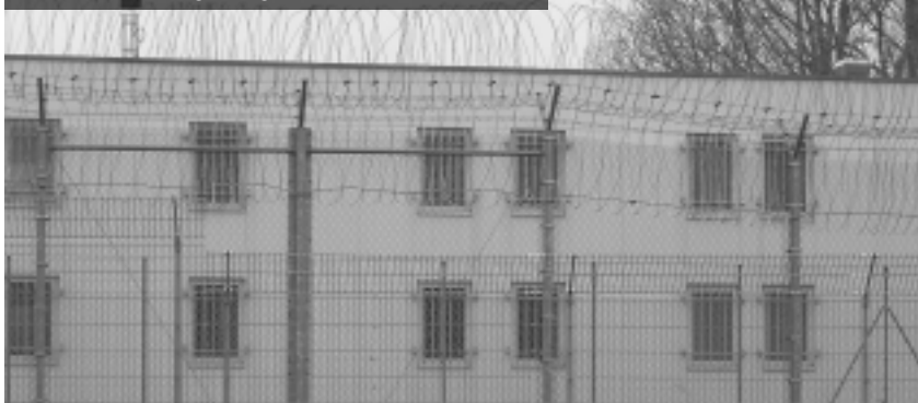
Das Abschiebegefängnis in Eisenhüttenstadt